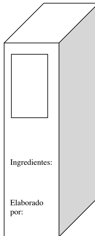
Panel de Información

Existen varios reglamentos que determinan los requisitos que aplican al etiquetado de alimentos. Todos los alimentos empacados para venta al público tienen que estar etiquetados adecuadamente. Existen 5 áreas de requisitos obligatorios que deben incluirse en las etiquetas.